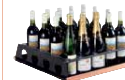
Degustations-Regal bis zu 20 Flaschen stehend