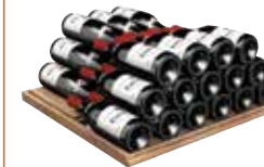
Lagerregal für bis zu 77 Flaschen