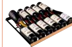
Gleitregal für bis zu 12 Flaschen