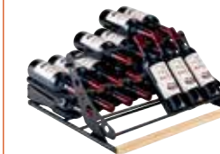
Präsentationsregal für bis zu 32 Bordeaux-Flaschen