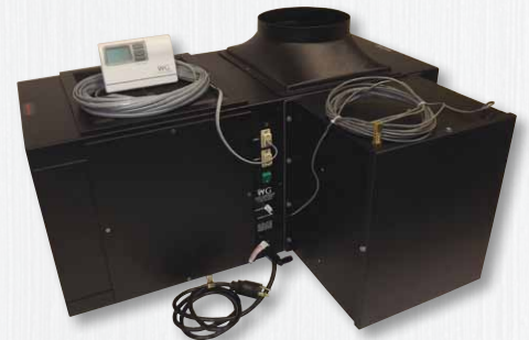
Abbildung zeigt ein System mit optionalem, integrierten Luftbefeuchter