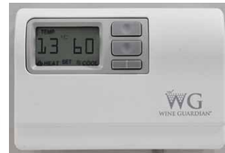
Das Benutzer-Kontrollsystem mit Fernzugriff zeigt die Temperatur in Grad Fahrenheit oder Celsius an