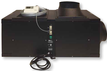
Seitenansicht der Steuerung